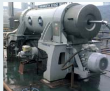
Industria produzione catrame - Coal tar industry - Industrie de production de goudron