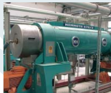
Trattamento fango aerobico - Aerobic sludge treatment - Traitement des boues aérobiques