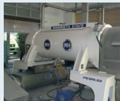
Trattamento fango anaerobico - Anaerobic sludge treatment - Traitement des boues anaérobiques