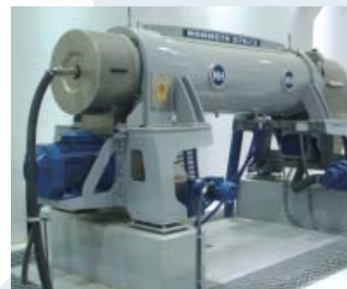
Impianto municipale trattamento acque reflue - Municipal waste water treatment plant - Station d'épuration des eaux usées ménagères