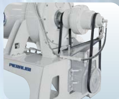
Particolare Rotovariatore e riduttore - Detail of Rotovariator and reduction gear - Vue du Roto-variateur et du réducteur

Le ROTO-VARIATEUR électronique consomme peu d'énergie car l'énergie absorbée est restituée au moteur principal.